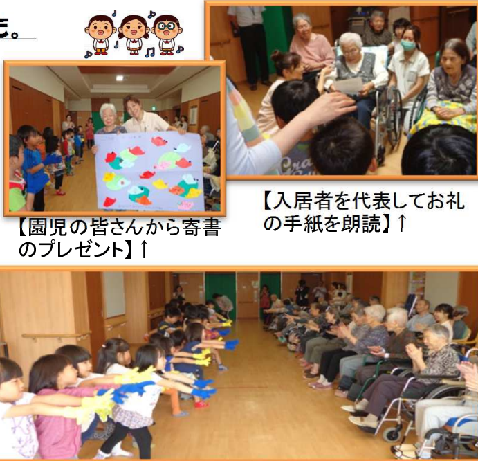
【園児の皆さんから寄書のプレゼント】↑

6月19日(金)に、当施設の隣りのすずらん保育園の園児の皆さん35名が施設を訪れました。入居者の皆さまに、園児の皆さんと触れ合って楽しんでいただくために、当施設で企画しました。園児の皆さんには、これまで何度も施設に来ていただいておりますが、今回も、歌とハンドダンスを元気いっぱい披露していただき、入居者の皆さんは、満面の笑顔と拍手で見守るように楽しんでいました。 演技後、入居者の代表から園児の皆さんへ、お礼の手紙が朗読され、園児の皆さんとは一人ひとり、握手をして終了しました。「また来てくれるといいね。」との声も聞かれました。 【かわいいダンスにたくさんの拍手が・・・】