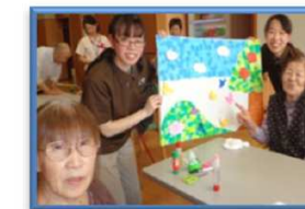
【トランプ遊び】 【切り絵】